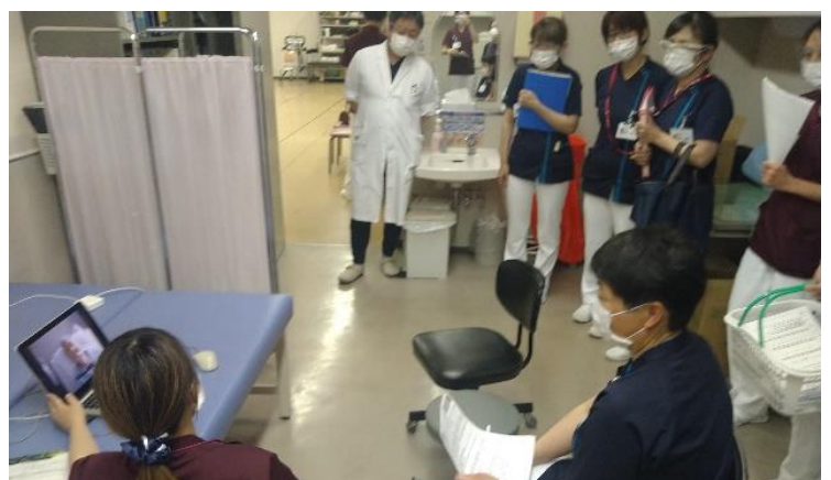
患者さんの食事場面の動画を共有している場面