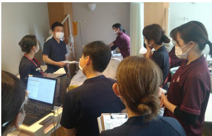
食支援チームのラウンド

病棟ヘラウンドを行い、対象患者さんの身体・精神及び口腔ケアの状況等を確認します。