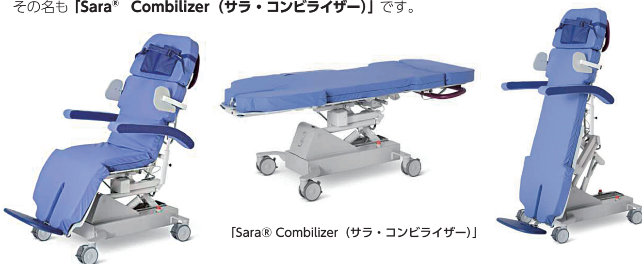
「Sara® Combilizer (サラ・コンビライザー)」

そこで当院では、看護部と合同に患者さんの早期回復を支える新しい機械を北陸で初めて導入しました。その名も「Sara® Combilizer (サラ・コンビライザー)」です。