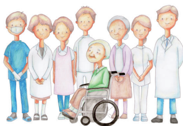
公立能登総合病院 骨粗しょう症リエゾンチーム